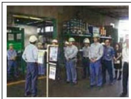
交通安全キャンペーン

毎年随時、全豊田外来工事教育を行っております。 2012年度 全豊田作業責任者教育 3名 全豊田作業責任者更新教育 20名 感電防止特別教育 35名 高所作業特別教育 35名