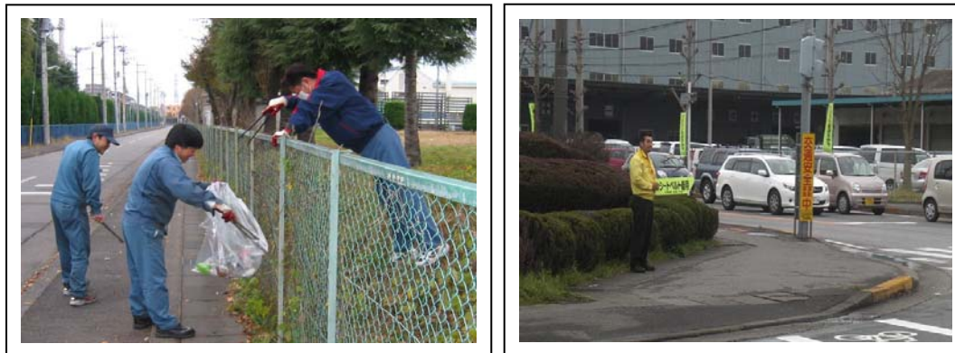
工業団地内一斉清掃