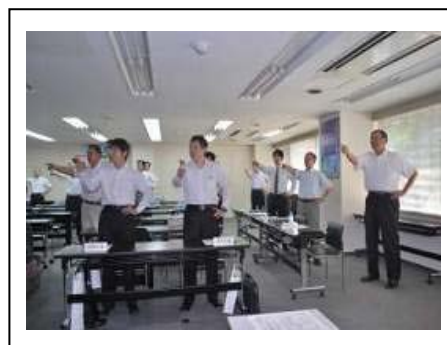
社内安全衛生大会