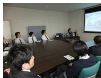
交通安全キャンペーン

初回登録 : 1999年11月29日 登録証番号: JQA-EM6596 登録日 : 2010年10月1日 登録更新日: 2011年11月29日 有効期限 : 2014年11月28日