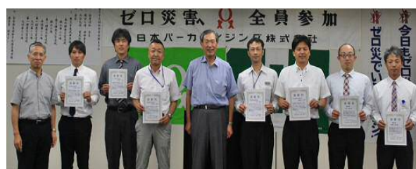
社内安全衛生大会

毎月 安全衛生だよりの発行 毎月 交通安全だよりの発行 毎月 月次報告 年2回 交通安全キャンペーン 年1回 安全衛生巡視 年1回 環境巡視 年1回 内部監査 年2回 中央安全衛生環境委員会 年1回 社内安全衛生大会